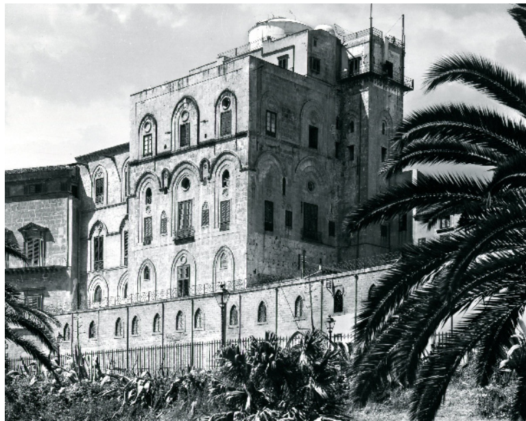
89521 - PALERMO - Palazzo Reale - Torre Pisana (Periodo Arabo) - (Stat. D. Anderson)